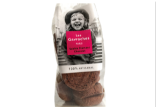
Sablés Diamant Chocolat - 100g