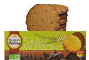
Sablé des Moissons 140g