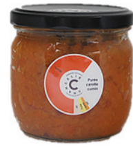
Purée Carotte Cumin 300g