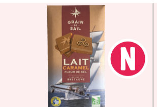
Tablette Chocolat au lait Caramel/Fleur de sel - 100g