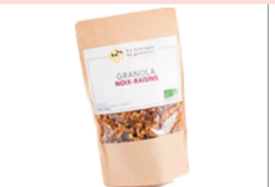
Granolas Noix Raisins - 340g