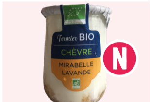
Yaourt au lait de chèvre Mirabelle / Lavande - 125g