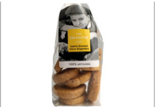
Sablés Diamant Citron gingembre - 100g