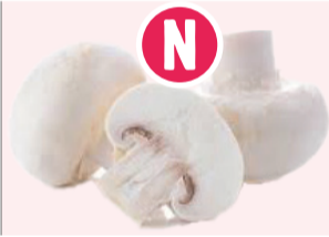
Champignons de Paris