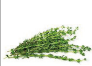
Thym sec botte