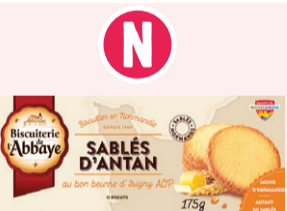
Sablés d'antan Beurre d'Isigny AOP - 175g