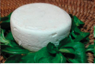
Chèvre frais Nature - 180g