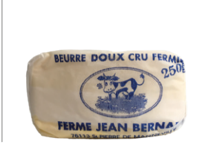
Beurre fermier Doux - 250g