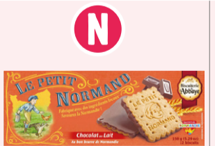
Petit Normand Chocolat au lait - 150g