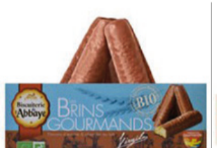
Brins gourmands 160g