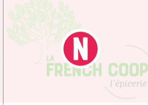
Gaspacho Tomate / Menthe - 50cl