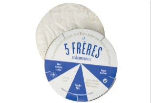
Camembert 5 Frères Lait Cru - 250g