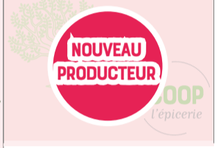
Oignons Jaunes - botte