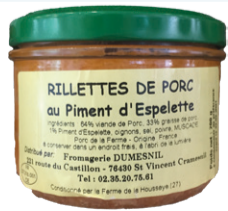
Rillettes Porc Fermières Piment Espelette - 200g