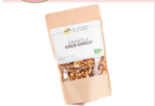
Granolas Coco Choco - 340g