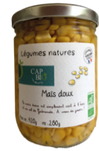
Mais doux 460g