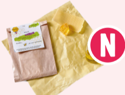
Apifilm Taille S - 18x20 cm

Remplace le film étirable alimentaire plastique • Cire d'abeille