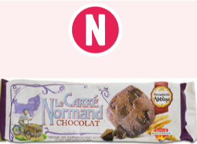
Carré Normand Chocolat - 140g