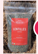
Lentilles Vertes - 900g