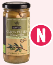
Olives vertes farcies Aux amandes - 350g