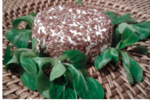
Chèvre frais Graines de Lin - 180g