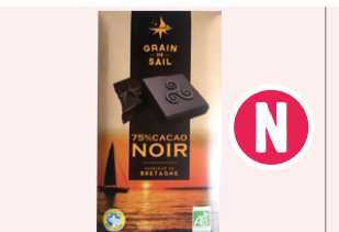
Tablette Chocolat noir 75% - 100g