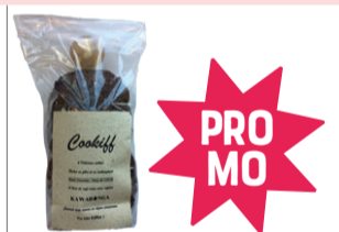
Cookiff Coco Chocolat PROMO