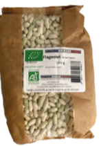
Flageolets Verts secs 500g