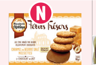
Petits Trésors - Choco lait/ Caramel beurre salé/