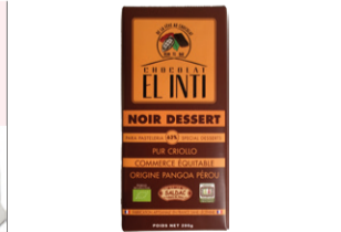
Tablette Chocolat noir 63% spécial desserts - 200g