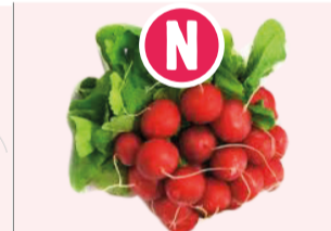
Radis rond rouge botte