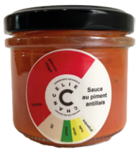
Sauce Piment 80g