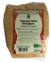
Couscous blanc 500g