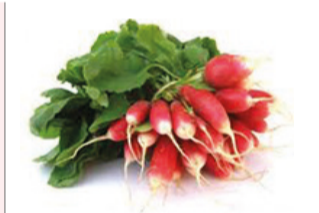
Radis rose botte