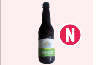
Bière PC Spring/ Printemps - 33cl