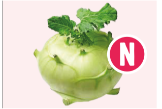
Choux Rave vert