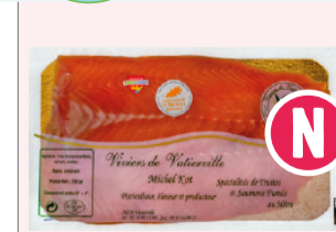
Filets de truite fumée x2 125g