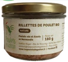
Rillettes Poulet Nature - 080g