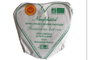
Cœur de Neufchâtel 200g