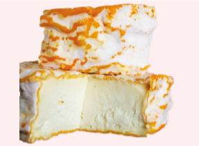
Petit Havrais 160g