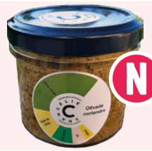
Olivade Coriandre - 80g