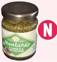
Moutarde Ail des ours / ortie - 90g