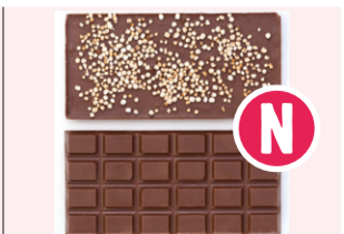
Tablette chocolat noir Quinoa