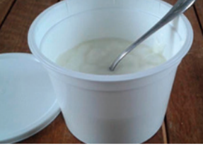
Fromage Blanc Chèvre 350g