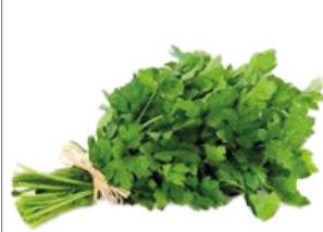
Persil plat botte