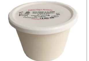
Crème Crue Fermière 250g