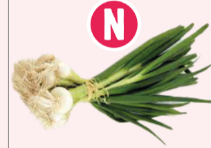
Oignons Blancs nouveaux - botte