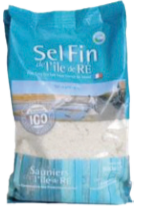
Sel fin 500g