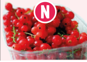
Groseilles Barquette 125g