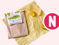
Apifilm Taille M - 26x28 cm