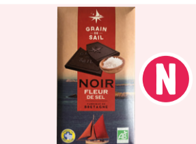
Tablette Chocolat noir Fleur de sel - 100g