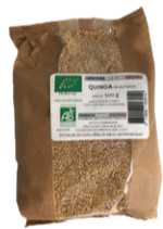
Quinoa avec saponine - 500g