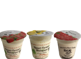
Yaourt aromatisé 125g