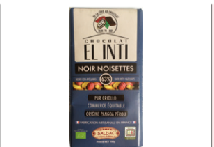
Tablette Chocolat noir Noisettes 63% - 100g