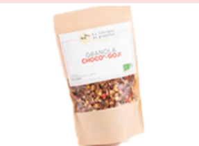
Granolas Choco goji - 340g