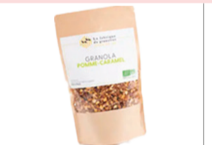
Granolas Pommes Caramel - 340g