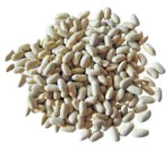
Haricots Blancs secs 500g