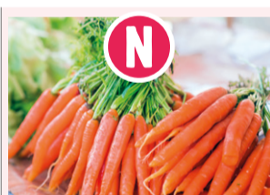
Carottes nouvelles botte