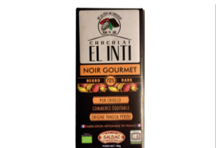
Tablette Chocolat noir 70% cacao - 100g