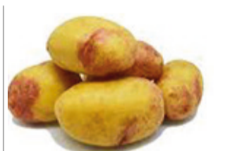
Pomme de terre Ditta (ferme)