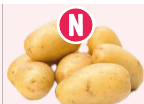
Pomme de terre Nouvelle