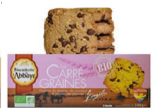
Carré graines 140g