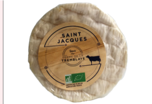
Saint-Jacques de la Tremblaye (Coulommiers) - 250g