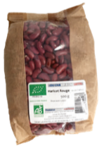
Haricots Rouges Secs 500g