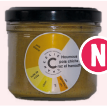
Houmous - Pois Chiche Raz El Hanout - 90g