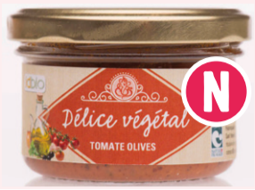
Tardinade Délice végétal Tomates / Olives - 100g