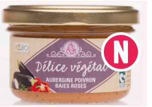
Tardinade Délice végétal Aubergine / Poivron - 100g