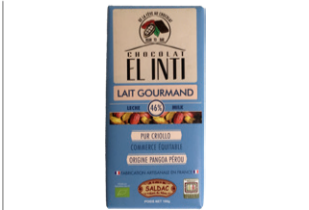
Tablette Chocolat au lait 46% - 100g