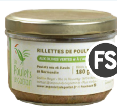
Rillettes Poulet Olives/Ail des Ours - 180g