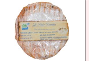
Pêché Parisien 220g