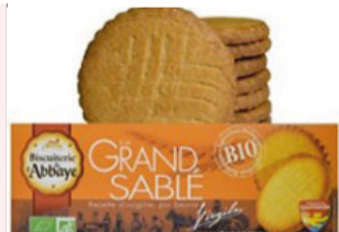
Grand Sablé Pur Beurre - 175g