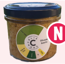
Olivade Basilic - 80g