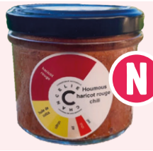
Houmous Haricot Rouge Chili - 90g