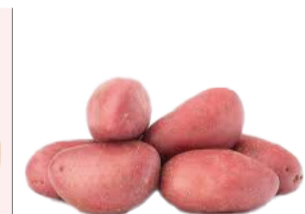
Pomme de terre Alouette (polyvalente)