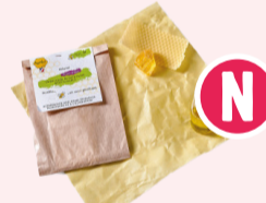
Apifilm Taille L - 33x36 cm