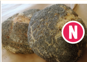
Pain-graines tournesol, lin, pavot, anis - 500g