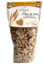
Pâtes Crêtes de Coq épeautre et blé - 250g