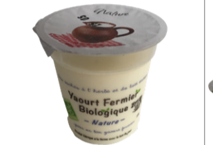
Yaourt nature 125g