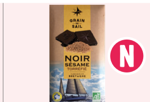
Tablette Chocolat noir Sésame torréfié - 100g