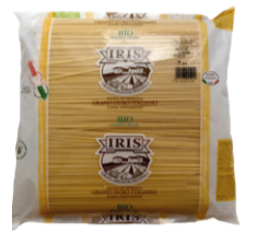
Tagliatelles blanches 5kg