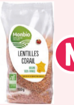
Lentilles rouges Corail - 500g