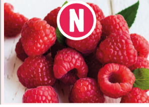
Framboises Barquette - 125g