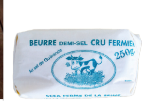
Beurre fermier Demi-Sel - 250g