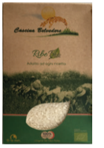
Riz long blanc - 1kg