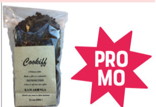
Cookiff Praliné PROMO