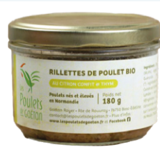
Rillettes Poulet Citron Confit - 180g