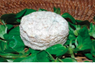
Chèvre demi-sec Nature - 180g