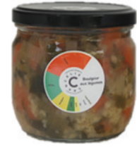
Boulgour de Légumes 300g