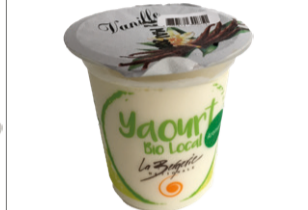
Yaourt Aromatisé Vanille - 125g