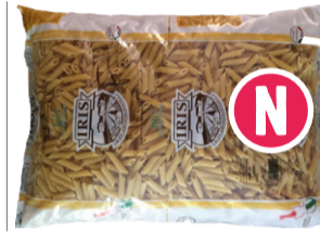
Pene blanches 5kg