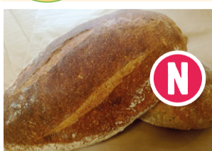
Pain Complet 500g