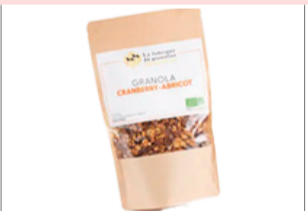
Granolas Cranberry Abricot - 340g