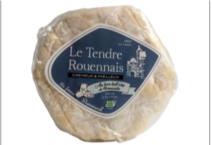
Tendre Rouennais 280g