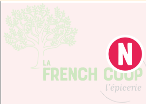
Pain Sarrasin 50%